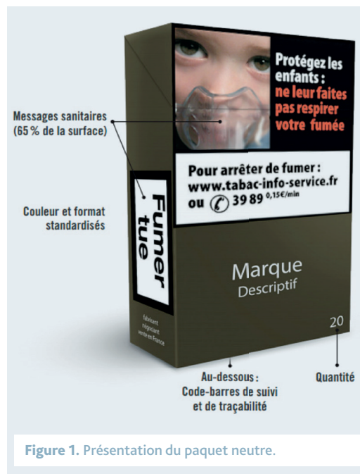
Figure 1. Présentation du paquet neutre.

Malgré cela, la consommation de tabac en France reste à des niveaux préoccupants. En effet, les derniers résultats du baromètre santé mené en 2014 montrent que 34 % des Français de 15 à 75 ans sont fumeurs et que 29,1 % fument tous les jours. Le tabagisme quotidien concerne plus de 40 % des hommes âgés de 20 à 44 ans, et presque un tiers des femmes âgées de 20 à 54 ans. En 2014, près de 7 adolescents de 17 ans sur 10 avaient déjà fumé une cigarette (68,4 %), et l'usage quotidien progressait dans cette population, passant de 31,5 % en 2011